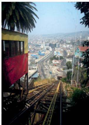
Photo de Valparaíso